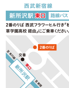
秋草学園高等学校